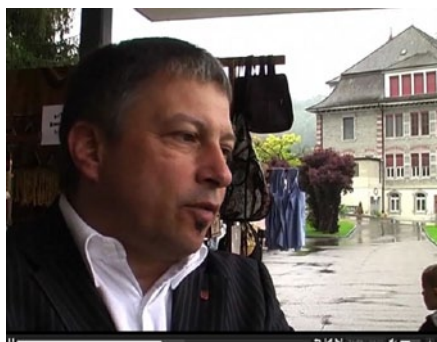
Reflets de productions d'élèves.