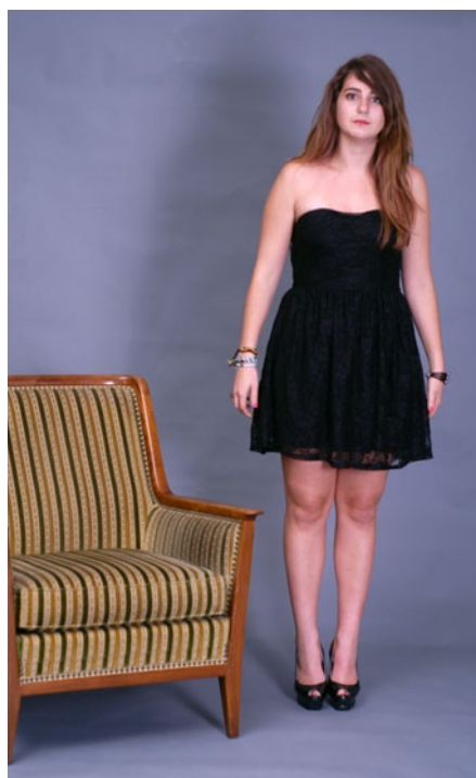
Une première série d'images réalisée sans consignes ni aide.